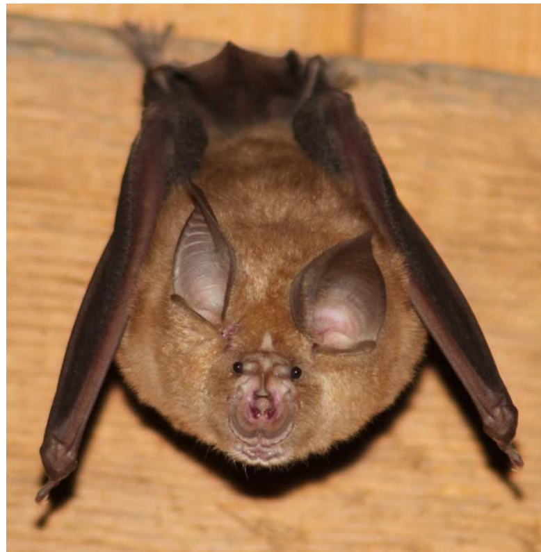
Abb. 1: Grosse Hufeisennase, erwachsenes Tier.

Die Grosse Hufeisennase gehört mit einer Flügelspannweite von 35–40 cm zu den grössten einheimischen Fledermausarten und ist zugleich die stattlichste Vertreterin der 5 Hufeisennasenarten Europas. Hufeisennasen sind an ihrer hufeisenförmigen Hautbildung um die Nasenlöcher sehr gut erkennbar